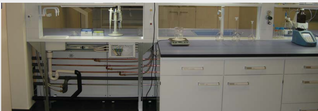
سکوبندی Köttermann با سیستم Exploris